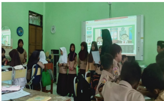
siswa mempresentasikan hasil kerja kelompok