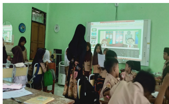
siswa mempresentasikan hasil kerja individu